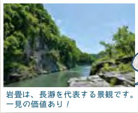
岩壘は、長瀬を代表する景観です。一見の価値あり!